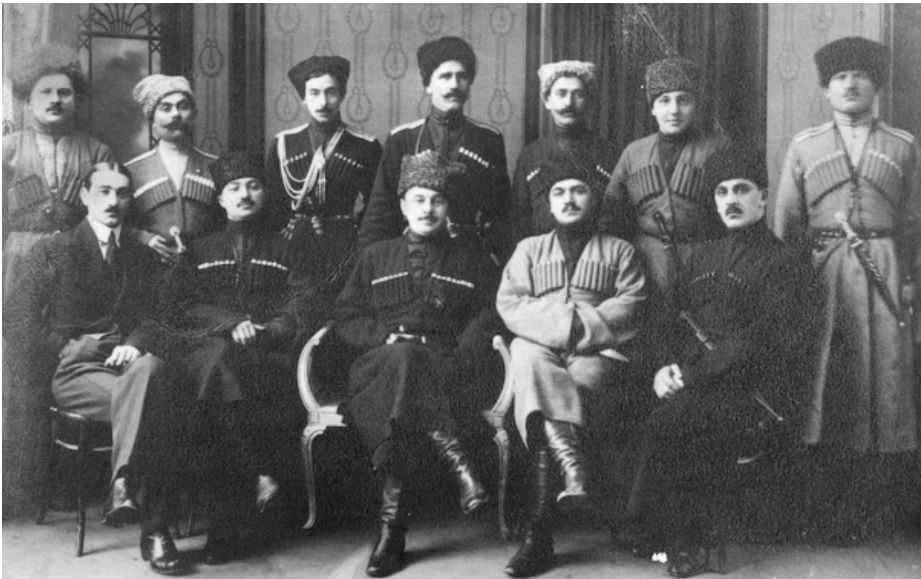
Руководители Горской республики во Франции. 1920 год

Большое значение в данной ситуации приобрело развитие частной благотворительности и формирование системы взаимопомощи в рамках северокавказских диаспор. Российские беженцы-мусульмане, включая представителей различных народов Северного Кавказа, получали определенную поддержку и от турецкого правительства. Современный черкесский автор Кадыр Натхо в одной из своих публикаций, в